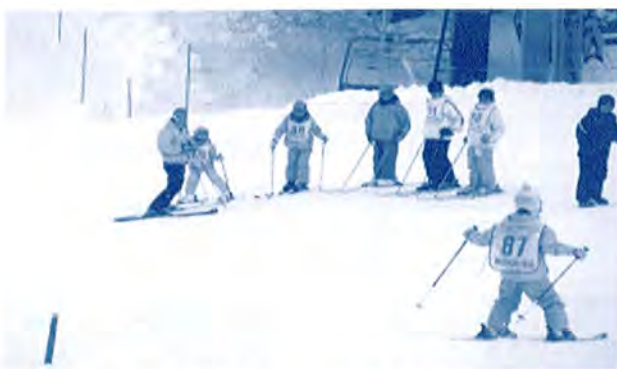
NASPAスキーガーデンにて 2日目のショートポール

今シーズンも大勢のジュニアの 参加者を期待しておりますので、 是非とも、お申込み下さい。