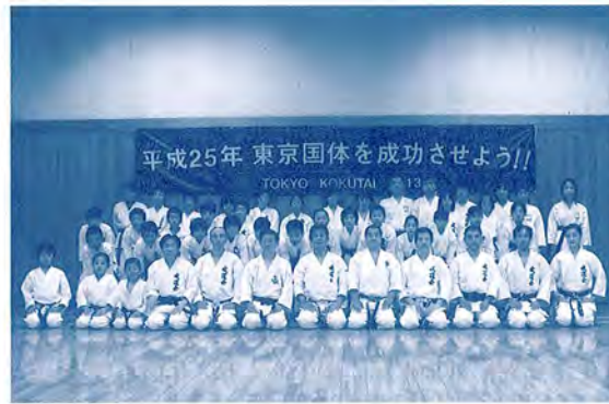
ジュニアスポーツ空手道教室の開催 平成21年1月11日

は試合形成を取り入れ、その都度、 選手の良い点、悪い点を指導した。 平成20年度事業は形競技、組手競 技ともに技術面のレベルアップを 図り、東京国体に向けて、有意義 な事業ができた。