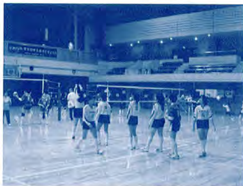
ジュニアバレーボール教室開催 平成20年12月23日

今回の教室は、当初の目的は十分とはいえないまでも、ある程度は達成されたと思っております。また同じスポーツを行っている子供たちが、初めて一堂に会し練習できたことは、今後の子供たちにとっても、私たちにとっても大きな意味があり、多摩国体に向けより良い内容を検討しながら、今後もジュニアの事業に取り組んでいきたいと考えています。最後になりますが、ご協力いただいた東京都バレーボール協会、市内中学バレーボール部の顧問の先生方、教室当日ボランティアで協力いただいた狛江セブンの保護者の方々に感謝申し上げます。